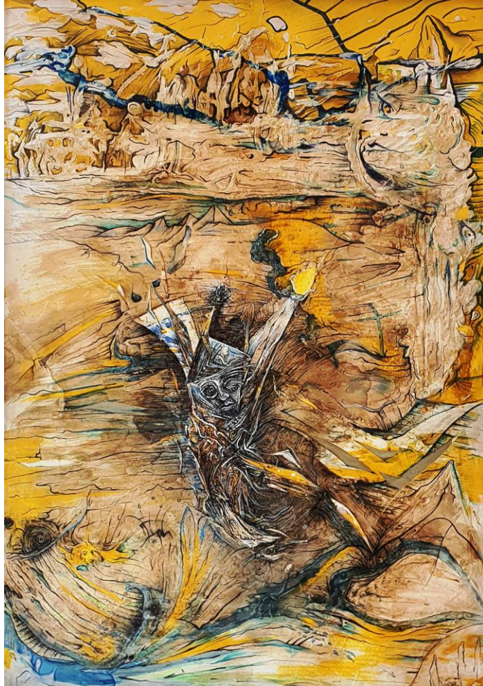
Z cyklu: NEOONIRYZM „Przemiana”, 2019 - mix-media, 100x70 cm