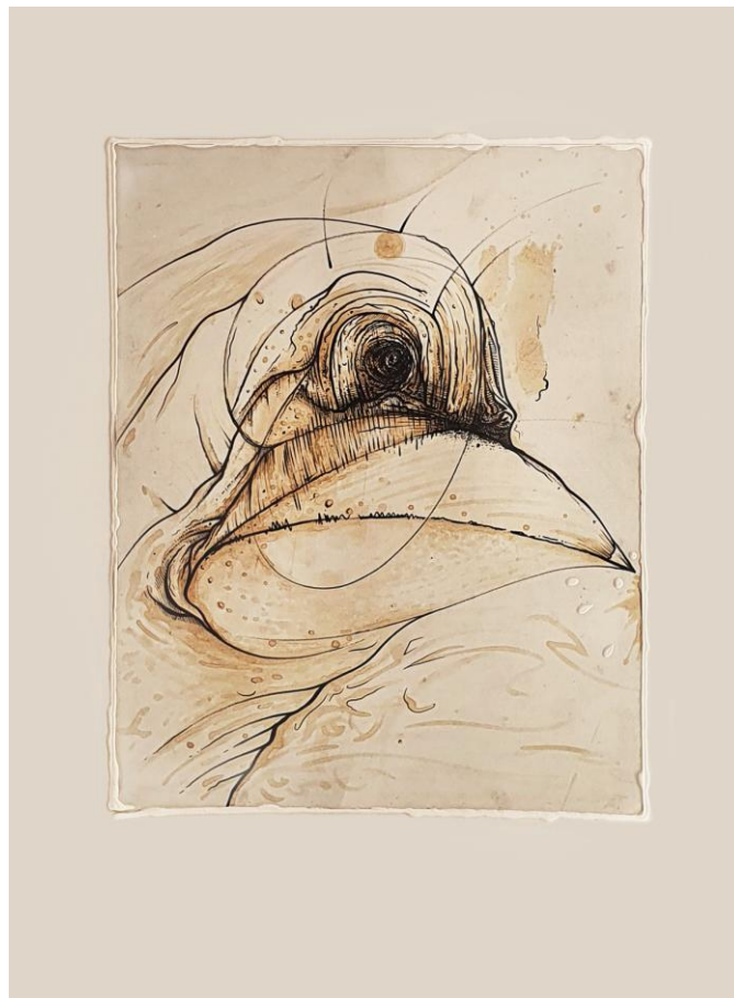
Z cyklu: NEOONIRYZM „W gnieździe”, 2019 - mix-media, 50x70 cm

2003 - Nagroda PUB Galerii PIRANIA w VI Ogólnopolskim Turnieju Satyry im. Ignacego Krasickiego ”O ZŁOTĄ SZPIŁĘ”, Centrum Kulturalne, Przemyśl.